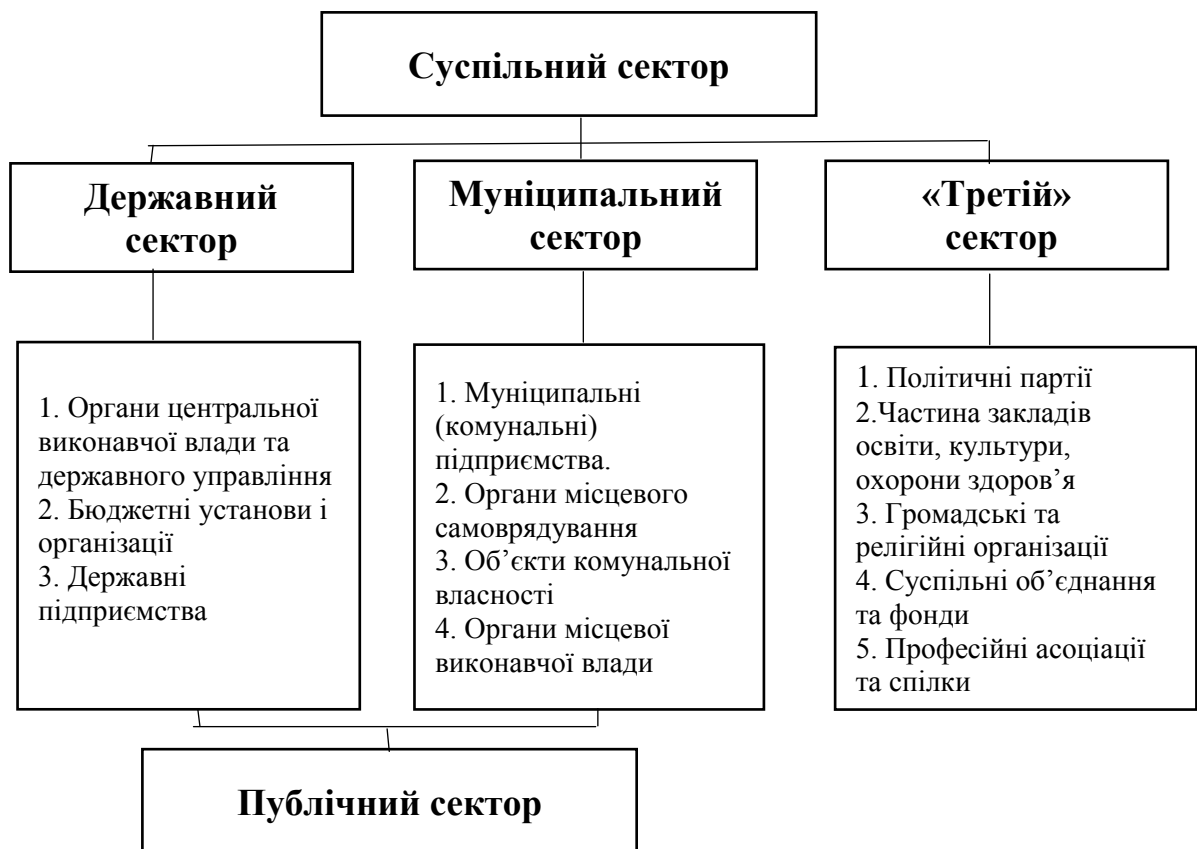
Рис. 1. Структура суспільного сектору економіки Fig.1. The structure of the public sector of the economy

Виходячи з цього, структурно суспільний сектор економіки визначається як єдність державного, муніципального та суспільно-добровільного підсекторів, діяльність яких спрямована на ліквідацію недоліків ринку та виробництво і розподіл соціально-значущих благ. Зважаючи на складність та неоднозначність функціонування інституційних одиниць, що входять до складу суспільного сектору, багатоаспектність взаємозв'язків, між його структурними складовими, важливість впливу результатів їх діяльності на забезпечення добробуту суспільства, постає необхідність об'єктивного оцінювання ефективності суспільного сектору економіки. Узагальнюючи існуючі напрацювання вітчизняних та зарубіжних вчених [1-6, 8], в даному дослідженні розглядатимемо існуючі підходи до оцінювання ефективності суспільного сектору, виходячи з його структури, наведеної на рис. 1.