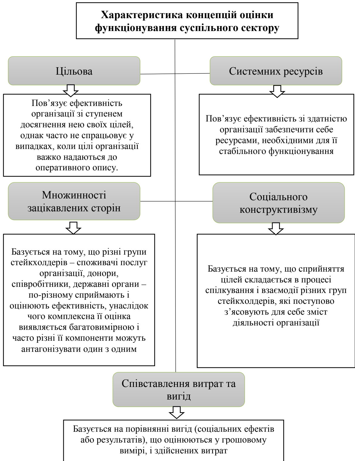
Рис. 2. Основні концепції оцінки функціонування суспільного сектору Fig. 2. Basic concepts of assessing the functioning of the public sector

Різноманітність підходів не спрощує, а навпаки, ускладнює процедуру їх практичного використання з метою визначення ефективності діяльності структур суспільного сектору. Зокрема, така ситуація пов'язана з відсутністю загальноприйнятої