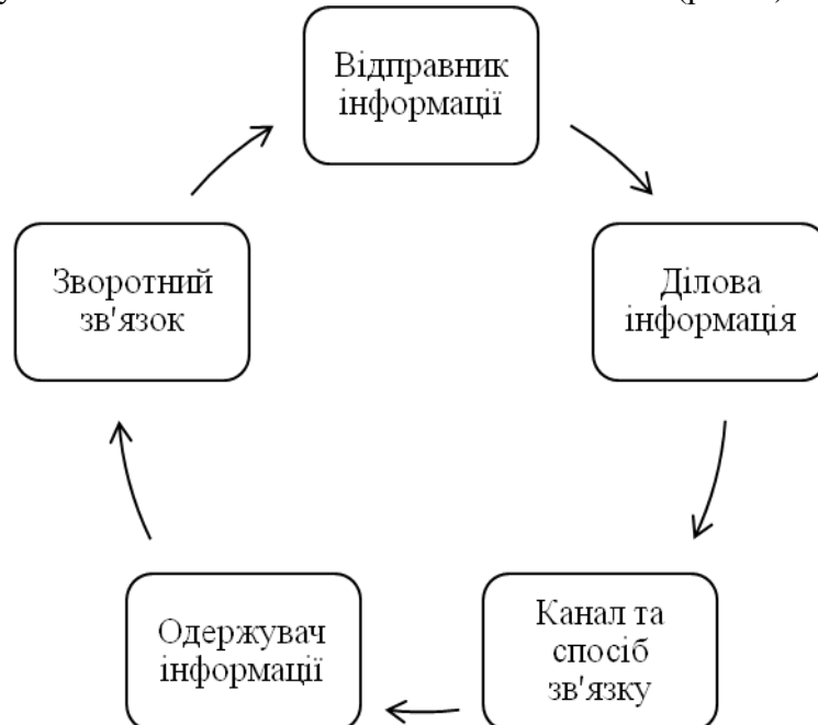
Рис. 1. Основні елементи ділового спілкування*

Ділове спілкування є втіленням його основних елементів (рис. 1).