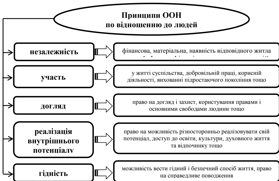
Рис. 1. Принципи ООН щодо людей похилого віку

Поліпшення якості життя населення літнього віку дедалі більше стає стратегічною метою, на виконання якої наразі спрямовується політика соціально орієнтованих держав світу. Місце і роль літніх людей найбільш точно висвітлено в Принципах ООН «Зробити повноцінним життя осіб похилого віку» [7], прийнятих 46 Генеральною Асамблеєю ООН 16.12.1991 р., які можна структурувати в п'ять груп: незалежність, участь, догляд, реалізація внутрішнього потенціалу, гідність (рис. 1).