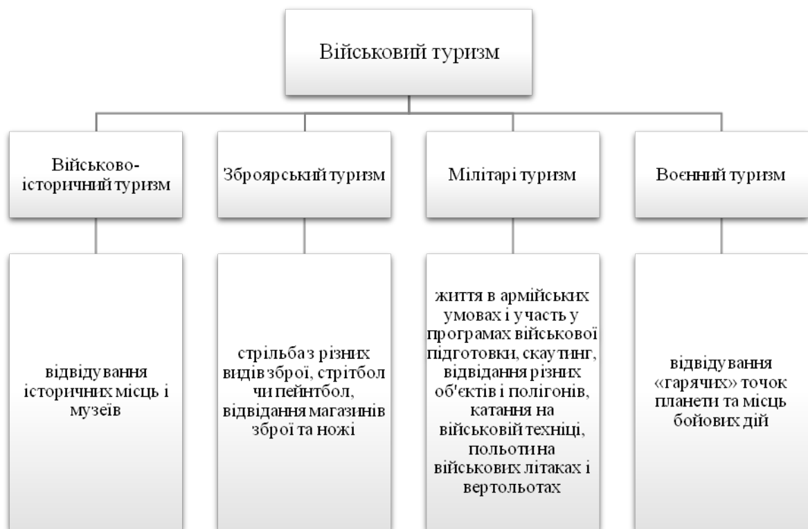
Рис. 1. Підвиди військового туризму за М. П. Кляп та Ф. Ф. Шандор Fig. 1. Subspecies of military tourism according to M. P. Klyar and F. F. Shandor

Інші науковці В. Кушнар'єв та О. Поліщук із військовим туризмом ототожнюють мілітарі-туризм і описують його як частину сегменту спеціалізованого туризму, що містить елементи розважального, пригодницького, екстремального та пізнавально-історичного туризму, та включає в собі продукти, які стосуються військового обладнання та знання історичних подій. Також вони виокремлюють інші підвиди цього виду туризму (рис. 2) [9].