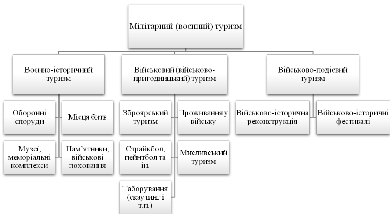
Рис.3. Класифікація воєнного (мілітарного) туризму за Д. Каднічанським та М. Каднічанською