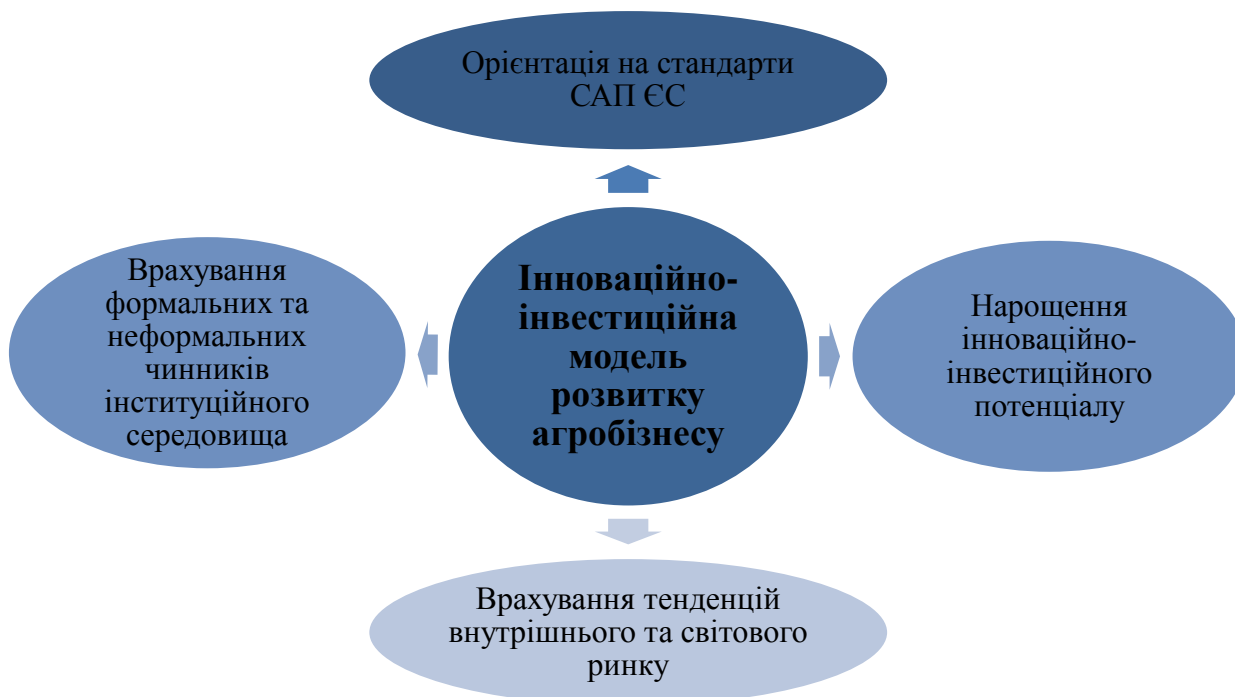
Рис. 3. Чинники стратегічних орієнтирів розвитку вітчизняного аграрного бізнес-середовища

Оновлену стратегію розвитку аграрного бізнесу в Україні доцільно базувати на європейській інноваційно-інвестиційній моделі. На рис. 3 зображено чинники стратегічних орієнтирів розвитку вітчизняного аграрного бізнес-середовища.