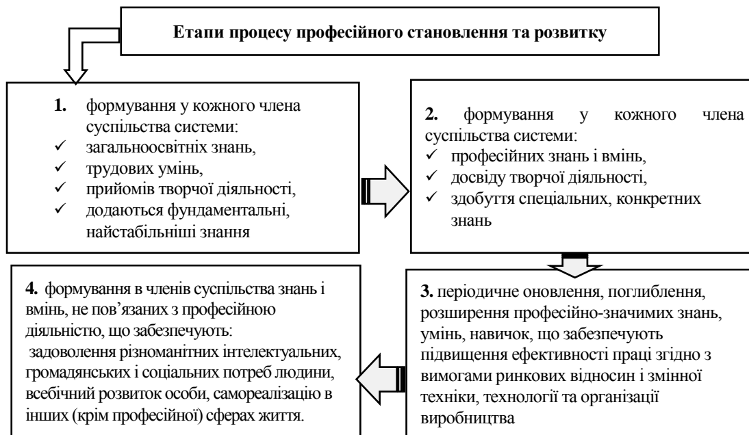
Рис. 2. Процес професійного становлення та розвитку* Fig.2. The process of professional formation and development*

Процес професійного становлення та розвитку, безперервний для суспільства в цілому, для окремого члена суспільства представлено на рисунку 2. Він складається з послідовних етапів, цілі яких є самостійними, але взаємопов'язаними, та засобами їх досягнення.