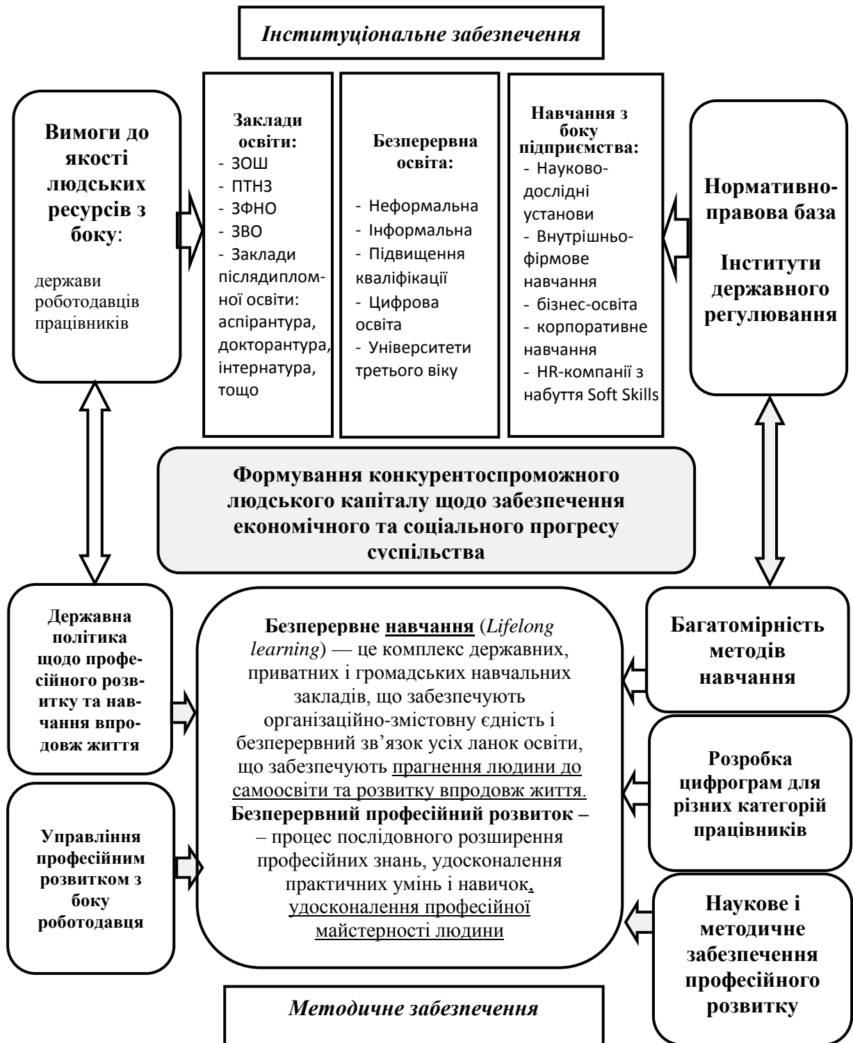
Рис. 3. Структурно-логічна модель системи безперервного навчання та професійного розвитку*

Для представлення загальної картини системи безперервного навчання в Україні розглянемо її структурно-логічну модель (рис. 3).