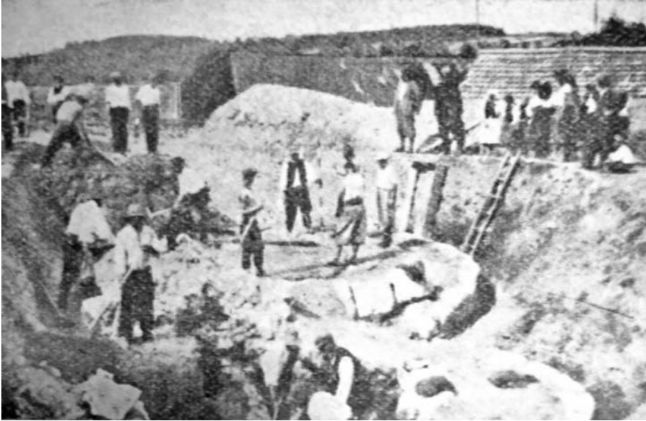
Розкопки Катедрі 1937 р. — Абсиди в задній стіні Катедрі