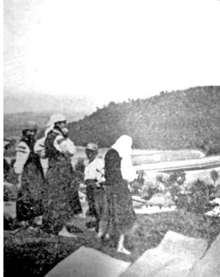
На Крилоській горі