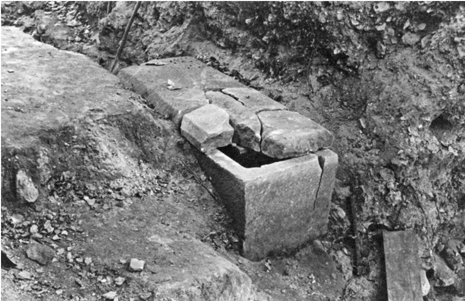
Саркофаг Відкопаний у фундаментах Катедрі в Крилосі